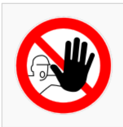
Zutritt für Unbefugte verboten